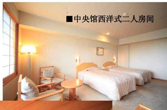
■中央馆西洋式二人房间