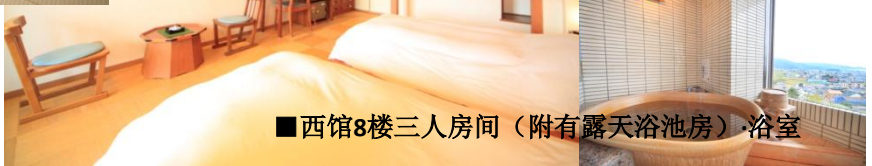
■西馆8楼三人房间（附有露天浴池房）浴室